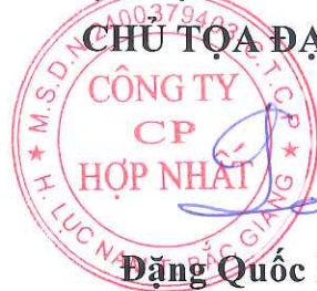
Đặng Quốc Lịch